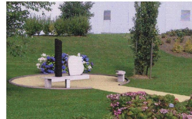
Stèle dédiée à nos tout-petits